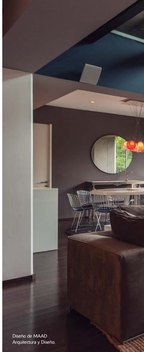
Diseño de MAAD Arquitectura y Diseño.

Los espacios cerrados o aislados son cada vez menos solicitados en el diseño de un hogar. Resulta mucho más agradable relacionar los espacios y aprovechar su uso constante al permitir que las personas circulen libremente, sin tener que estar abriendo y cerrando puertas, o sin sentirse apretados en espacios donde la circulación es difícil. Hoy, un diseño acertado provoca la comunicación total entre sala, comedor y algunas áreas exteriores, y muchas veces, la sala de televisión con el bar, de manera que los anfitriones tienen todo a la mano para largas horas de convivencia.